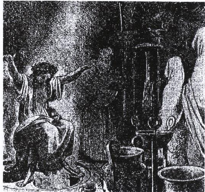
„Wehrsagerin“ in Delphi: Splone brachten ihr Information

Uri Geller zeigte uns die große Helfer-Rolle, die die Massenmedien für Okkultismus spielen.